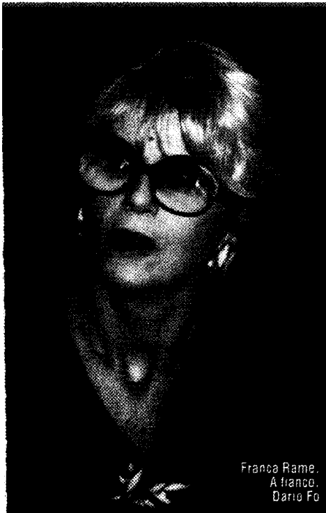
Franca Rame. A fianco: Dario Fo